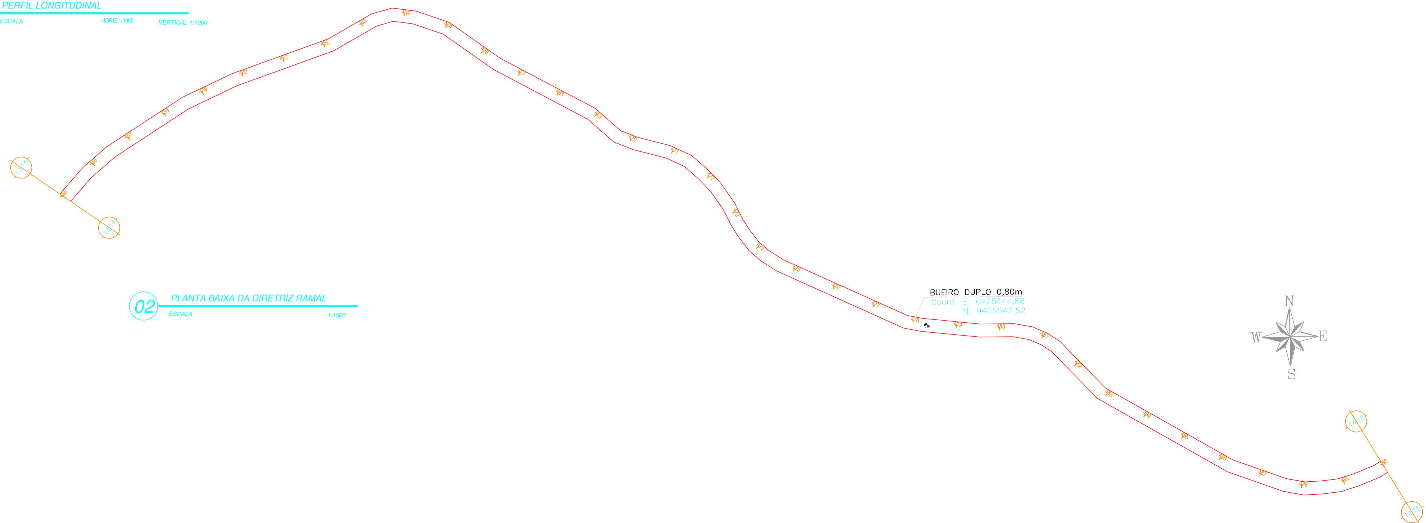
02 PLANTA BAIXA DA DIRETRIZ RAMAL ESCALA 1/1500