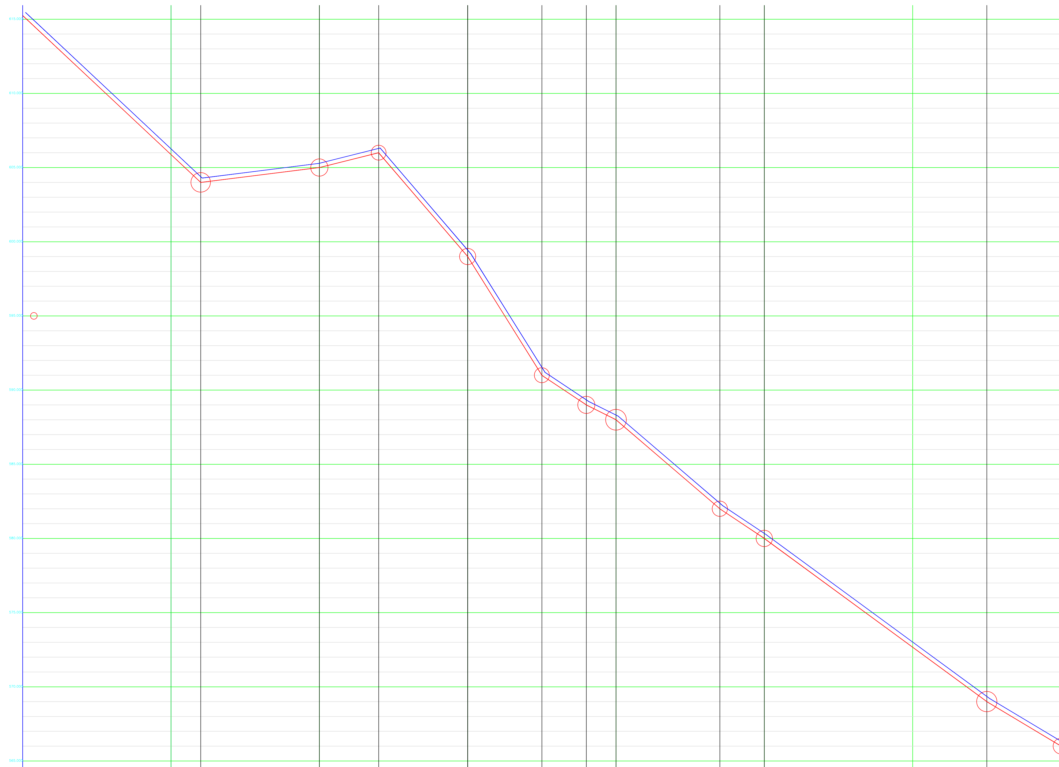
01 PERFIL LONGITUDINAL ESCALA HORIZ 1/1000 VERTICAL 1/1000