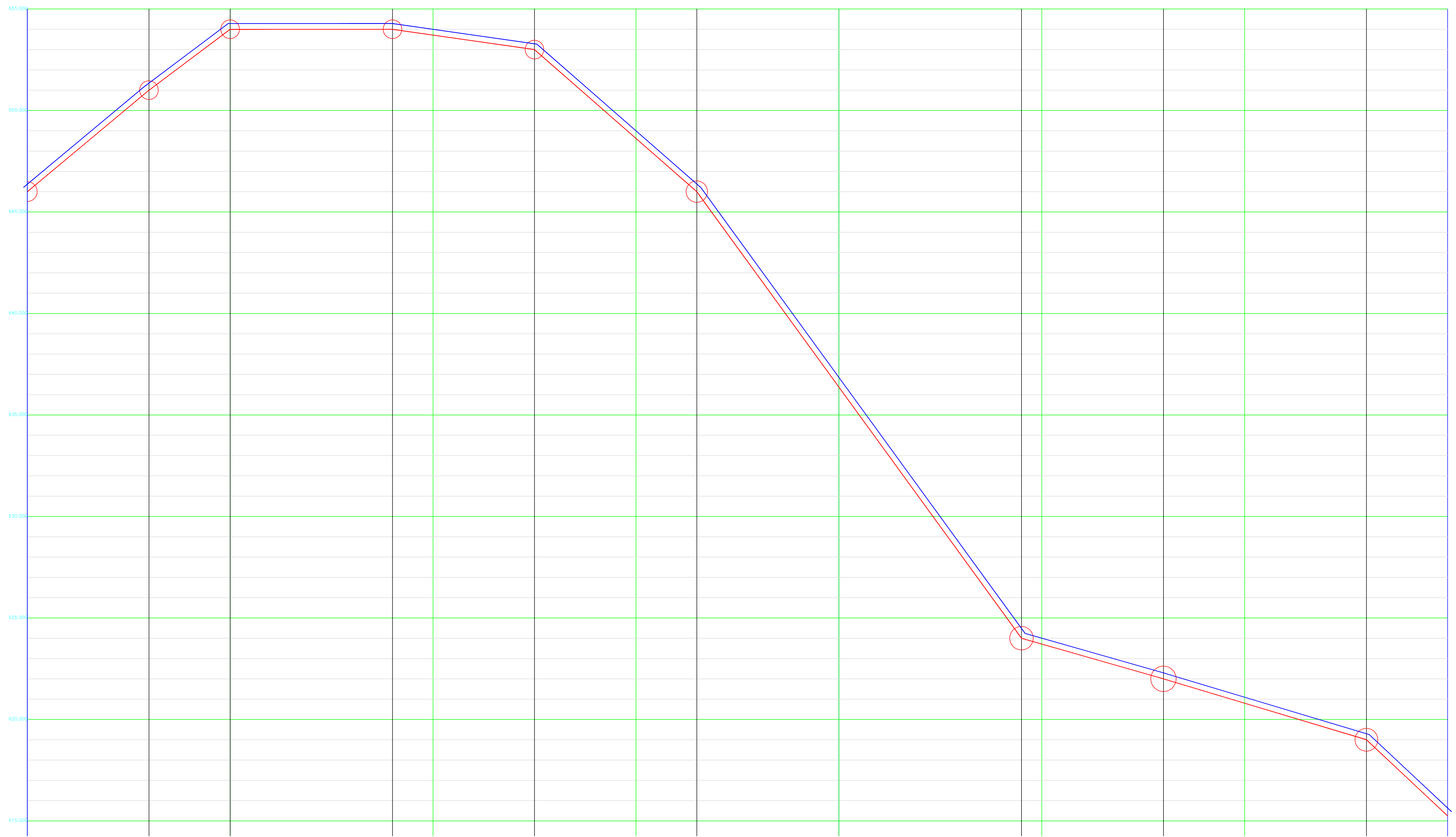
01 PERFIL LONGITUDINAL ESCALA: HORIZ 1/1000 VERTICAL 1/1000