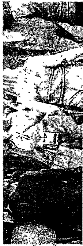
FRANQUIAS têm investimento inicial de R$ 9 mil até R$ 2 milhões

WWW.OPROYO.COM.BR SEGUNDA-FEIRA FORTALEZA - CEARÁ - 17 DE JULHO DE 2023