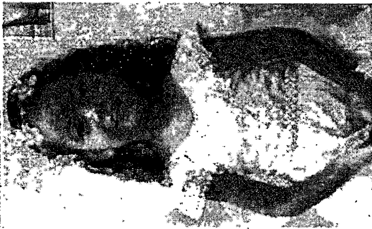
THAUANY tinha cinco anos