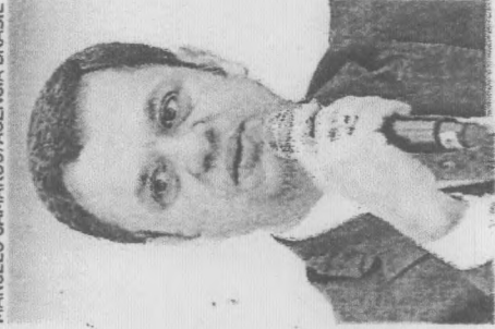
ANDERSON TORRES FOI MINISTRO DA JUSTIÇA DE BOLSONARO