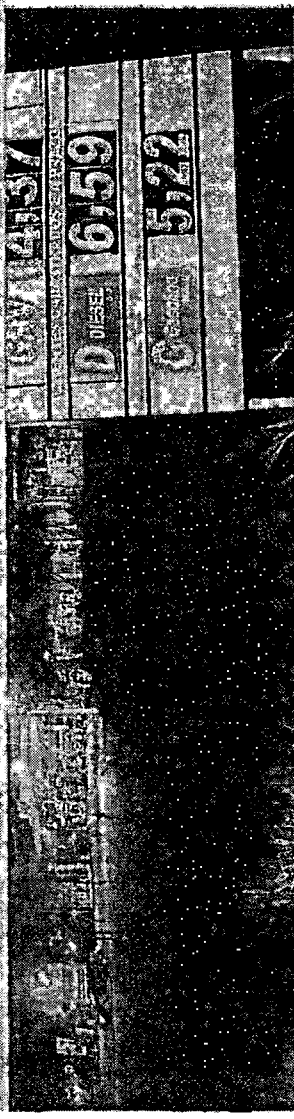
POSTO na BR-222 voltou a praticar valor menor do que R$ 5 nesta semana