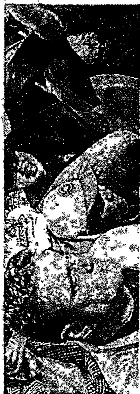
CAPITÃO WAGNER esteve, no último sábado, na cidade de Sobral

“A gente tem um voto espontâneo muito forte, também. Então, esses eleitores que têm o voto espontâneo, identificar uma liderança que tem capacidade de conduzir a campanha