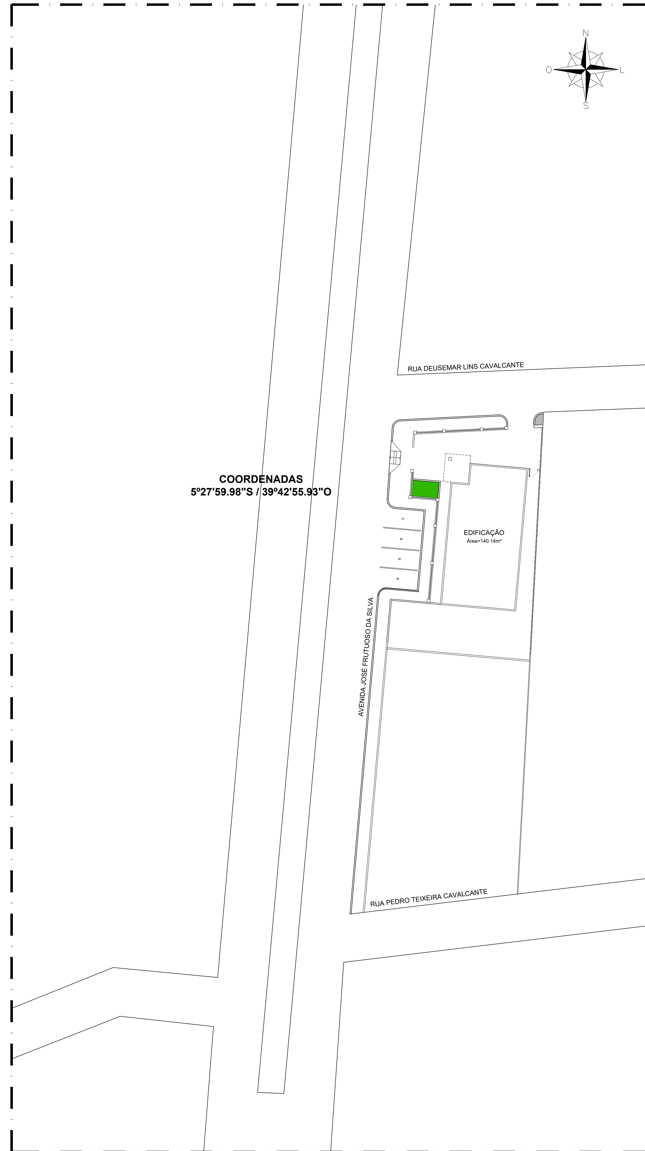
01.01 PLANTA BAIXA - SITUAÇÃO ESCALA 1/250